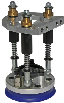
Держатели для датчиков второго слоя DBD